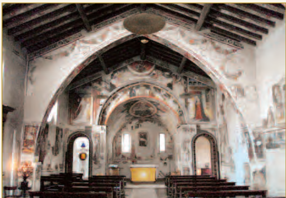
Mornico: chiesa dell'Addolorata.