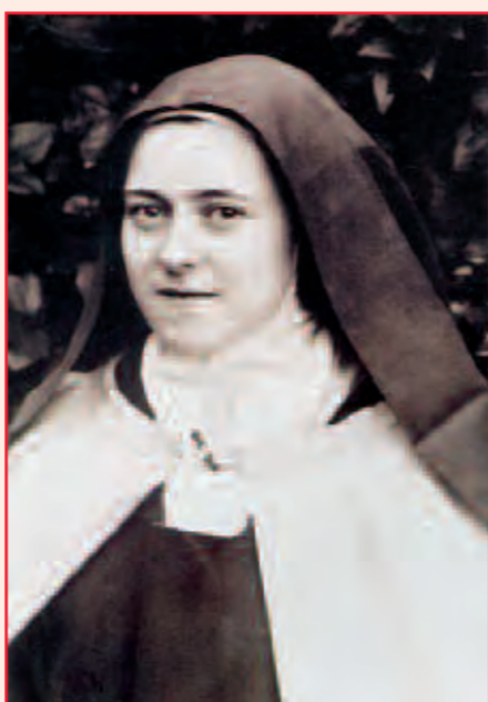
Santa Teresa di Lisieux.

La testimonianza appena riportata ci offre molti spunti ed evidenzia alcune linee di interpretazione, confermate da un'analisi degli scritti dalla Mazza. Con ogni probabi-