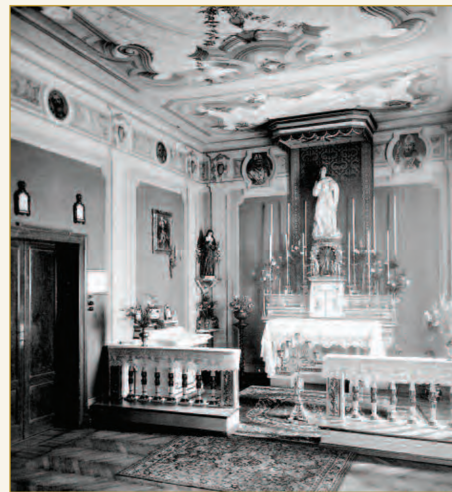
La cappella originale in villa S. Maria Assunta.